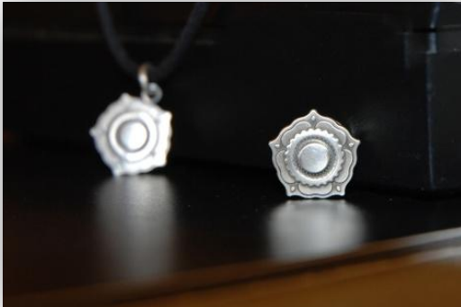
SOLMIOPIDIKE JA KORVAKORUT

Sotiemme Veteraanit –merkki kertoo tuhansia tarinoita rohkeudesta ja uskalluksesta. Taistelu isänmaan puolesta yhdisti suomalaiset vaaran hetkellä.